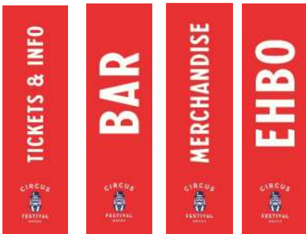
Hoge navigatiebanners terrein

Er zijn verschillende brainstormsessies geweest met het team en de vormgever. We wilde een vormgeving die bij het concept en de omgeving zou passen; alternatief, een beetje vreemd. Maar we wilde ook graag een toegankelijk zijn voor gezinnen, leuk en uitdagend voor kinderen en vrolijk. Onze vormgever Thunder & Bold heeft onze verwachtingen meer dan overtroffen door te kiezen voor een mascotte 'de circusdirecteur' die vrolijk is voor kinderen en ook tot de verbeelding spreekt voor volwassenen. Deze vormgeving is ingezet voor o.a. posters, social media templates, terrein banners met info, navigatiebanners op het terrein.