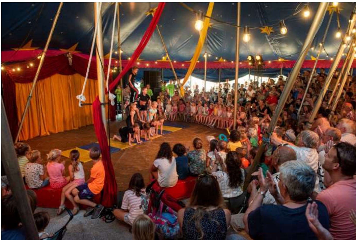
Volle tent tijdens de show van Woenzini

Op het grootste van de drie pleinen is een grote circustent opgezet waarin de betaalde shows plaatsvonden. Deze prachtige grote circustent heeft verschillende acts onder haar vleugels genomen. Op de zaterdag hadden we hier betaalde shows, en op de zondag workshops en shows voor de pet.