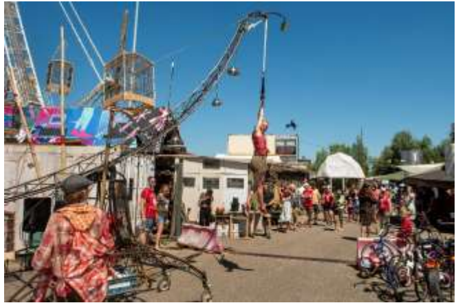
De Parade, De Machienerie