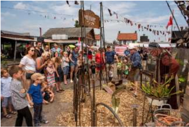
Het Animalium, De Machienerie

Op het Voorplein werd publiek direct bij binnenkomst overdonderd door de prachtige carrousel en decors van de Machienerie, een gezelschap uit België dat mechanische dieren bouwt die de hoofdrol spelen in hun carrousel en hun Animalium voor (bijna) uitgestorven diersoorten. Ook verzorgden zij de openingsact met hun Parade, een reizende installatie van trapezeartisten en jongleurs.