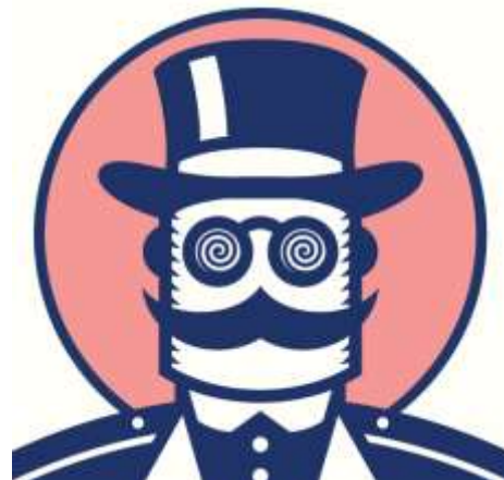
De Circus Directeur