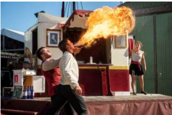
Crepe de la Bete, Hironnelles

Het middelste plein is omgedoopt tot Horecaplein, hier kon men wat eten en drinken terwijl er beide dagen verschillende artiesten optraden. Muzikanten als St.Ness, Scotch en het Boerensyndicaat, maar ook verschillende theatrale acts en gochelaars hadden hier hun podium.