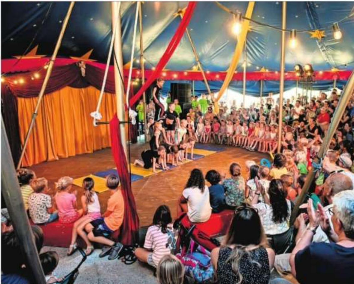
▲ Tijdens de voorstelling van jeugd-circus Woenzini uit Breda zit de grote circustent vol.